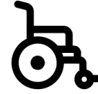
輔具及居家 無障礙環境改善